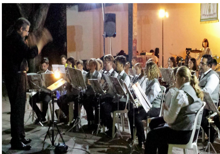
La Banda in concerto a Cogoletto