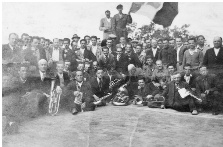
Nel dopoguerra si festeggia in musica un "1° Maggio" a S. Giulia